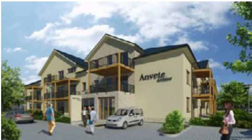
Otevření Anvete senioru: prosinec 2018

Anvete senior nabízí bezpečný a komfortní domov seniorům, kteří chtějí prožít aktivní stáří v kruhu svých vrstevníků. Nacházíme se pouze 15 km od Brna v obci Holubice . Nabízíme soukromí v 39 nájemních bytech, o velikostech 1+kk, 2+kk s vlastní kuchyňkou a sociálním zařízením. Byty jsou rozděleny do dvou propojených budov, kde naleznete kromě soukromých bytových jednotek také centrum aktivit a služeb (společenské místnosti, kavárnu, zimní zahrada, tělocvičnu, prádelnu, místnost pro služby-jako je např. kadeřník, pedikúra, ...). Součástí uzavřeného areálu je okrasná zahrada s jezírkem, venkovním altánem a hřištěm na pétanque. Anvete senior je určen pro soběstačné seniory, kteří nejsou trvale odkázáni na péči cizí osoby. V případě zájmu lze tyto služby nabídnout externí pečovatelskou službou.